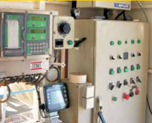
Centrale d'injection automatique