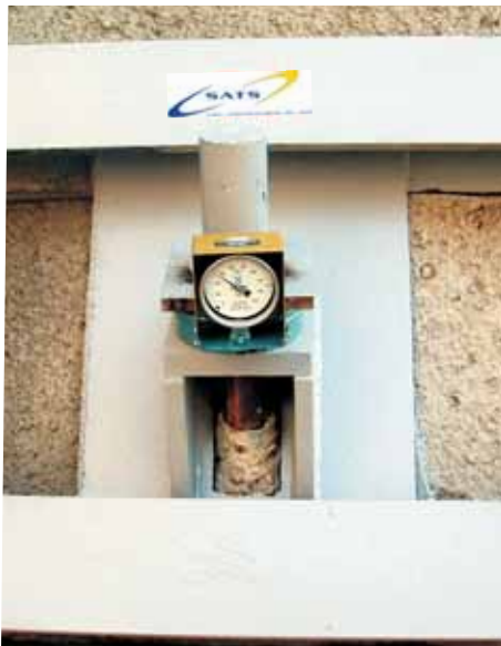
Cale de contrôle

B - Les contrôles dans le temps. Pour cela les tirants sont équipés de cales de mesure de tension permettant de suivre l'évolution et leur comportement dans le temps.