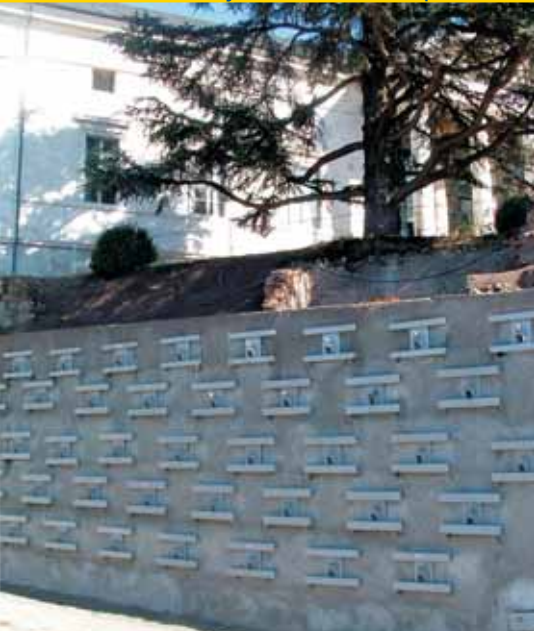
Paroi berlinoise tirantée

Les tirants souvent désignés sous le vocable « tirants précontraints », sont constitués par des armatures de précontraintes (barres ou multi-torons) scellées dans le terrain par injection et mises en tension en prenant appui sur l'ouvrage.