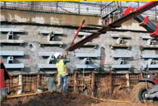
Équipement d'un tirant