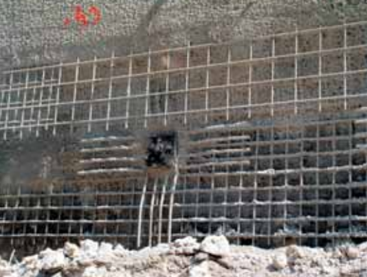
Détail tête de clou