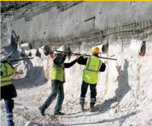
Equipement d'un clou